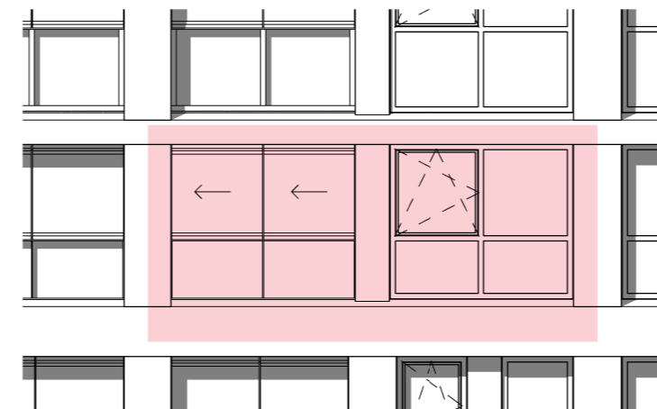
zuid aanzicht schaal 1 : 100