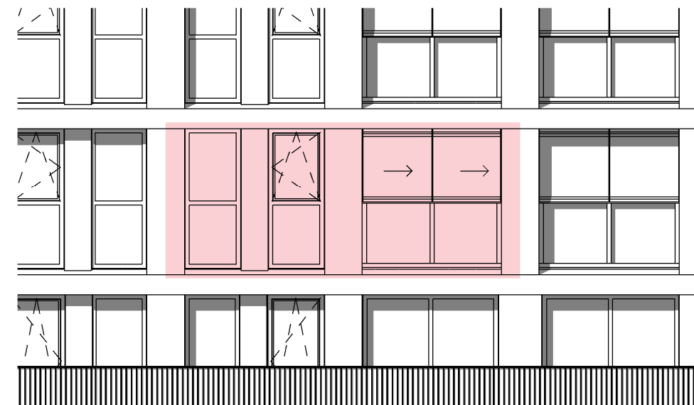
zuidaanzicht schaal 1 : 100