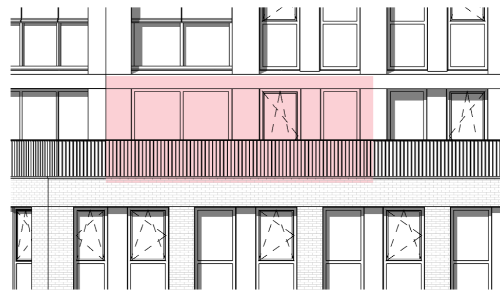
zuid aanzicht schaal 1 : 100