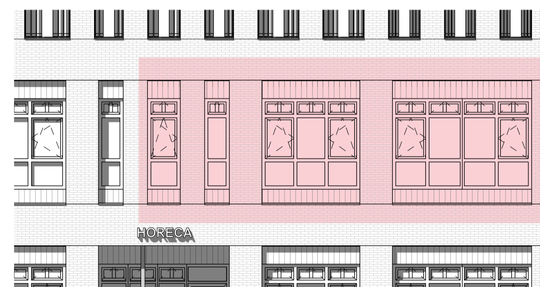
zuidwestaanzicht schaal 1 : 100