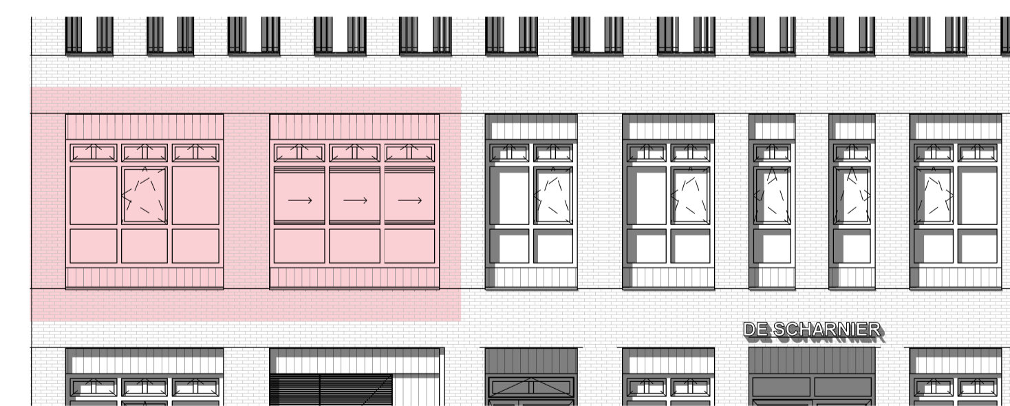
zuidaanzicht schaal 1 : 100